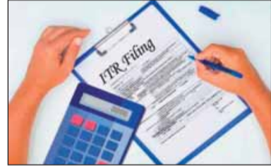
ली है। इनकम टैक्स का नया एक्ट 1 अप्रैल 2026 से लागू होने वाला है। इनकम टैक्स बिल 2025

बताया जाता है कि टैक्सपेयर्स के हित को ध्यान में रख सरकार ने ज्यादातर सिफारिशों मान