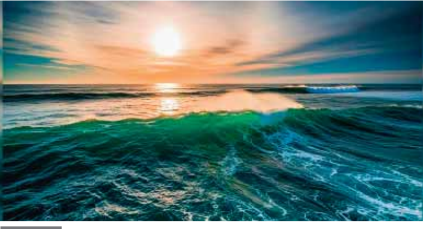
फिर कैसे बनने लगे समुद्र

पृथ्वी की उम्र लगभग 4.6 अरब साल है। जब पृथ्वी बनी थी, तब यह एक गर्म, पिघला हुआ गोला थी, जिसमें लावा और गैसें थीं। उस समय पृथ्वी की सतह इतनी गर्म थी कि कोई भी पानी तरल रूप में मौजूद था ही नहीं और ना रह सकता था। वैज्ञानिकों का मानना है कि पृथ्वी के ठंडा होने के बाद ही पानी की उत्पत्ति संभव हुई होगी। सवाल यही है कि इतना ज्यादा पानी आया कहाँ से? क्या ये पृथ्वी के अंदर से आया : वैज्ञानिकों का एक समूह मानता है कि पृथ्वी के बनने के दौरान इसके अंदर पानी मौजूद था। जब पृथ्वी एक गर्म गोला थी, तब इसमें कई रासायनिक तत्व और यौगिक मौजूद थे। इनमें हाइड्रोजन और ऑक्सीजन जैसे तत्व शामिल थे, जो पानी (H 2 O) बनाने के लिए जरूरी हैं। जैसे-जैसे पृथ्वी ठंडी हुई, ये तत्व आपस में मिलकर पानी बनाने लगे। पृथ्वी की सतह के नीचे, मेटल नामक परत में आज भी पानी मौजूद है।